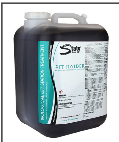
Pit Raider MC Traitement pour le sulfure d'hydrogène et la boue résiduaire