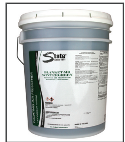
Blanket 50 Wintergreen MC Assainisseur d'air flottant