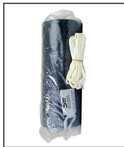
Block Worx MC BCT Bloc de bactéries chronorégulé