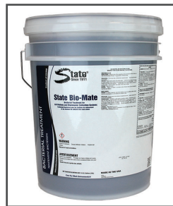
Bio Mate MC Catalyseur biologique