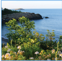
Coastal Dreams Natural Retreat

En plus de l'additif de neutralisation des odeurs SE-500 MC qui élimine les odeurs au lieu de simplement les masquer, les produits d'assainissement de l'air de State Industrial Products proposent une vaste gamme de fragrances pour ajouter un plus à tout type d'installation.