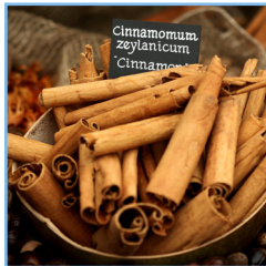
Épice Apple Spice French Vanilla Lemon Drop Cookie Spiced Apple Pie Wild Berry Spice