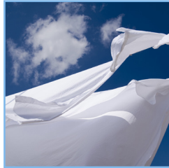
Fraisheur Abscent MC Clean Cotton Crisp Linen Fresh Linen Morning Fresh MC Paradise Breeze