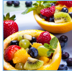
Fruit Apple Orchard ® Berry Citrus Grove Mango Martinique Orange Perfectly Peach Sweet Sunsation MC