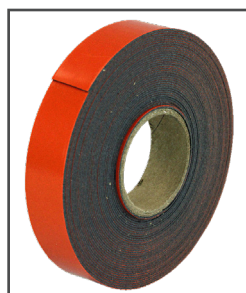
Make-A-Bond MC Ruban adhésif double face