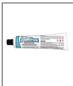
Formuflex® Adhésif/scellant transparent avec inhibiteur d'ultraviolets