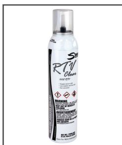
RTV MC Adhésif silicone/scellant/ calfeutrant/joint d'étanchéité