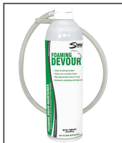
State® Foaming Devour™ Mantenedor de drenaje espumoso