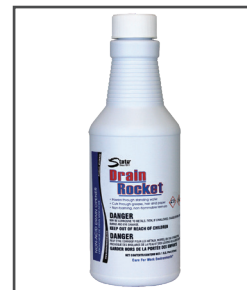
Drain Rocket™ Abridor de drenaje sin ácido