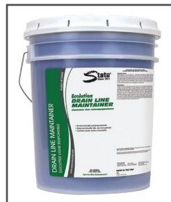
Ecolution® Drain Line Maintainer Mantenedor de trampa de grasa y estación de elevación