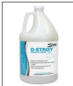
D-Stroy® Destructor de olores y mantenedor de drenaje