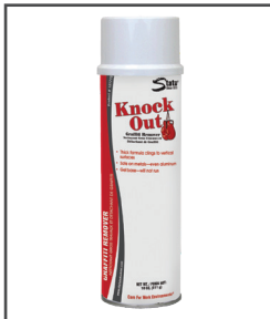
Knock Out MC Décapant aérosol pour graffitis et salissures