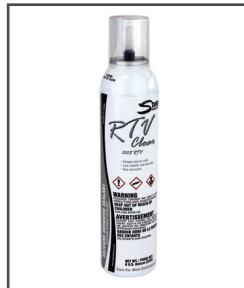
RTV MC Adhésif silicone/scellant/ calfeutrant/joint d'étanchéité